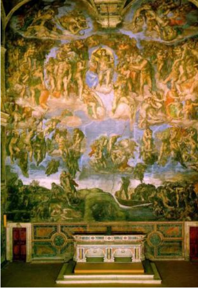
Miguel Ángel fue un artista del Renacimiento que decoró la capilla Sixtina del Vaticano.

En el siglo XV se inventó la impresión que permitió una más rápida transmisión de conocimientos e ideas. En el desarrollo cultural de la Edad Moderna se distinguen tres grandes etapas: el renacimiento , desarrollado en los siglos XV y XVI; el Barroco , en el siglo XVII; y la Ilustración , en el siglo XVIII.