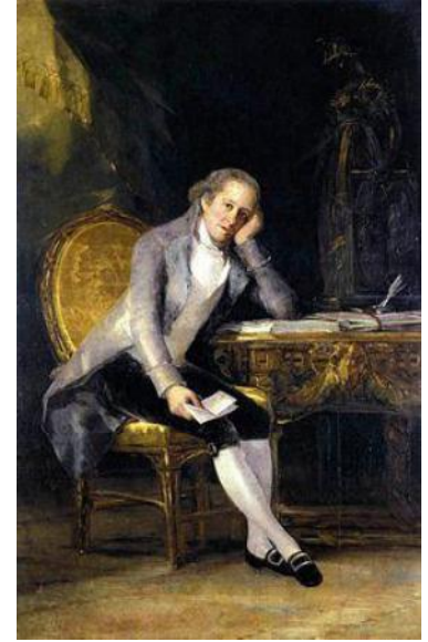
El retrato de Jovellanos, pintado por Goya puede ser considerado emblemático como imagen de la ilustración española.