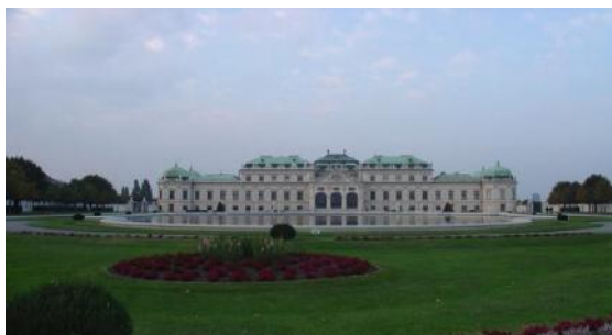
Los monarcas absolutistas construyeron palacios como el de Belvedere en Viena, Austria.

Durante la Edad Moderna el comercio tuvo una gran expansión. Además, se mantuvieron las diferencias sociales entre la nobleza (propietaria de casi todas las tierras), el clero (tenía tierras y no pagaba impuestos) y el pueblo llano (campesinos, artesanos y burgueses que se habían enriquecido gracias al comercio).