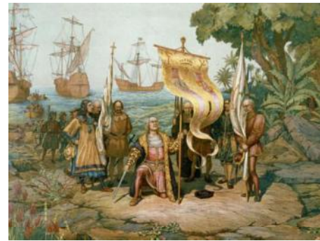
Llegada de Colón a América →

La navegación avanzó de tal forma que en 1492, Cristobal Colón dirigió una expedición que descubrió un nuevo continente: América . Se inició así la Edad Moderna .