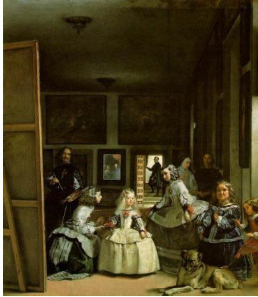
Velázquez fue un artista español del Barroco, que pintó, entre otros muchos, cuadros como "Las Meninas" que aparece en la fotografía.